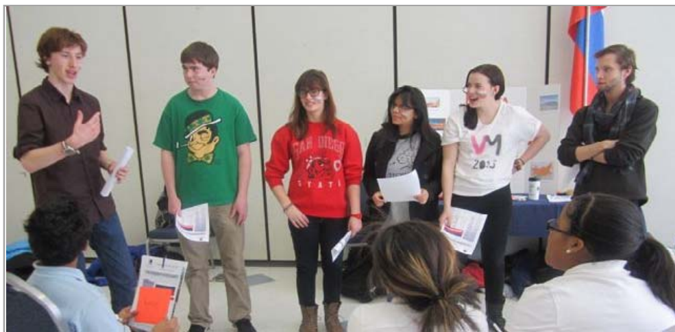
Первокурсники – детям: Да здравствует русский язык!