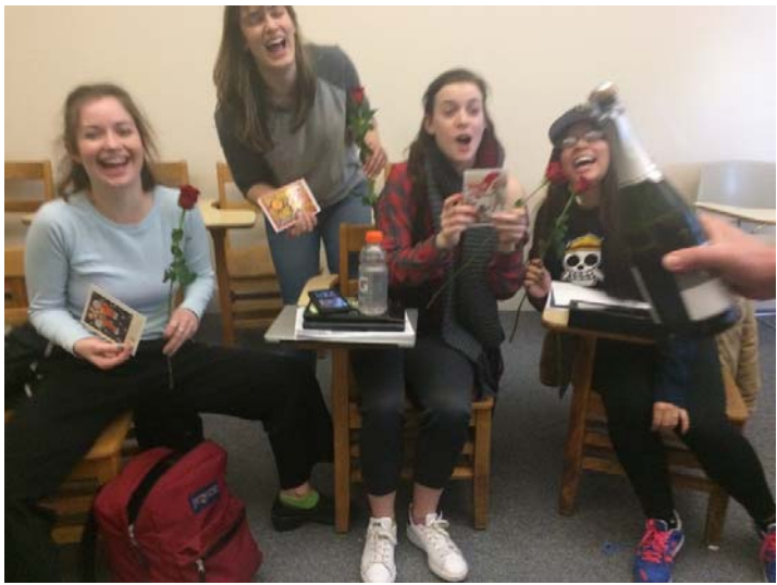
Как мы отпраздновали 8-ое марта? Безалкогольным шампанским!