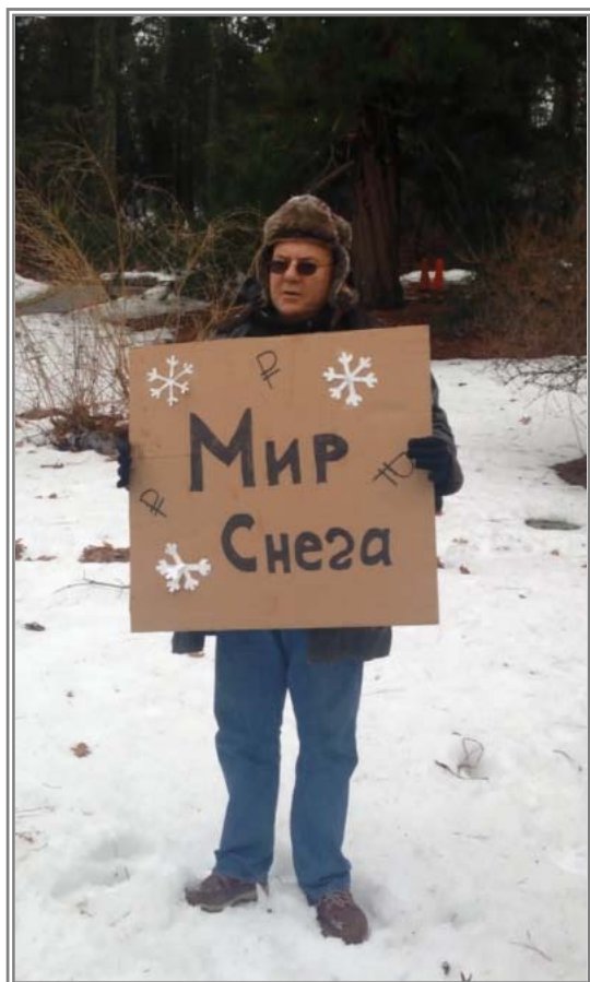
«Мир снега» (реклама)

Я – сумасшедший Михаил, сумасшедший Снеговик. На улице еще холодно, но скоро лето. Если вам зимняя погода нравится, вам нужен снег. Здесь в «Мире снега» у нас есть снег, много снега! Снег сейчас со скидкой до 50%. Если вы любите кататься на лыжах, вам нужен снег. Если вы любите кататься на санках, вам нужен снег. Запомните: летом нет снега! Принимайте меры сейчас, потому что количество снега ограничено. У нас супер-акция: при покупке одного килограмма снега, вы получаете в подарок второй килограмм. Скидки по клубным картам не даются.